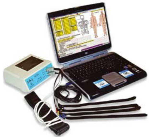
Sistema de electro-diagnostico-terapéutico computerizado denominado SCIO.

El instrumento SCIO es la evolución del QXCI. Se basa en los mismos principios y actúa en el mismo modo, pero actualmente la interfaz